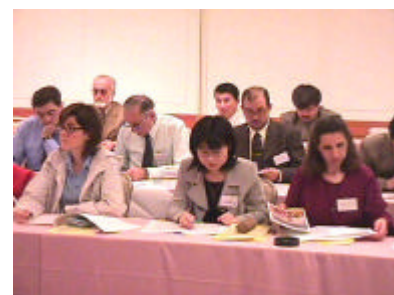
El Congreso anual es la principal herramienta de comunicación de los miembros de CANELA.

CANELA cuenta con una sección dedicada exclusivamente al estudio de la Metodología de la Enseñanza del Español Lengua Extranjera, constituida por docentes de reconocido prestigio, cuyas obras y publicaciones avalan una trayectoria profesional de excelencia y dedicación. Asimismo, las sec-