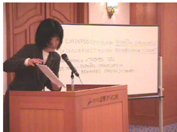
Es la única sociedad japonesa de hispanistas que emplea el español como lengua vinculante de todas sus actividades.

4. Desarrollo de páginas publicitarias (canon anual) Páginas secundarias, hiperenlazadas desde la página de partida 50.000 yenes