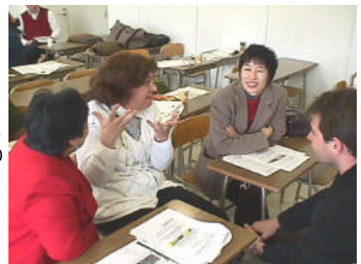
En talleres y seminarios se estudia y departe.