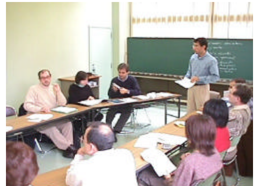
Un aspecto de uno de los talleres de Metodología ELE de CANELA.

La página Web de CANELA puede albergar banners e hiperenlaces de instituciones comerciales previo pago del canon correspondiente. Esto no implica que las